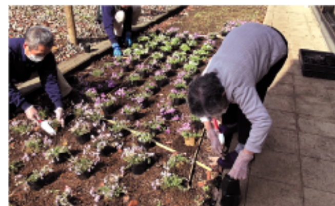
デイサービスのダイルームから見える屋外のスペースに、ご利用者に準備を手伝っていただきながら一緒に芝桜を植えました

園 芸活動も認知症ケアの一つですが、人が生活を営む上で緑を観る、土をいじるといった喜びは多くの人々が感じる活動です。 一般的にもガーデニングは、「果樹、野菜、花の手入れ、育て、収穫し、食卓にのぼらせ、生活を彩る」といった過程で、仲間と交流するきっかけにもつながります。 園芸作業では、座る、立ち上がる、掘る、水をまく、雑草を取りなど、数多くの動作を必要とするため、身体面では、運動能力や体力の維持増進、精神面でも、満足感や達成感、気分転換や記憶力の改善などの効果が期待されています。 デイサービスセンター初音の杜さん (@hatune8239) / Twitter 日々の様子を配信中