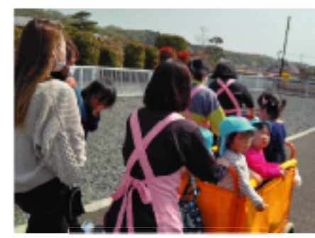
4月1日 入所を祝う会後、親子でお散歩に行きました