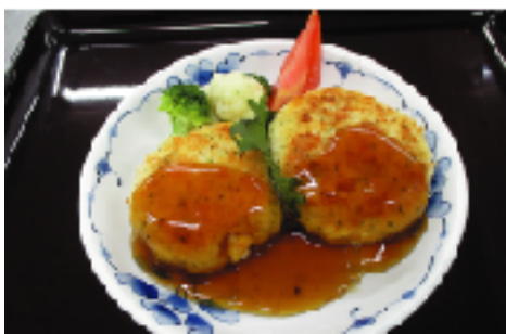
今回は新型コロナの影響で実食ではなく、レシピの静止画像データ、絵コンテで選考されました