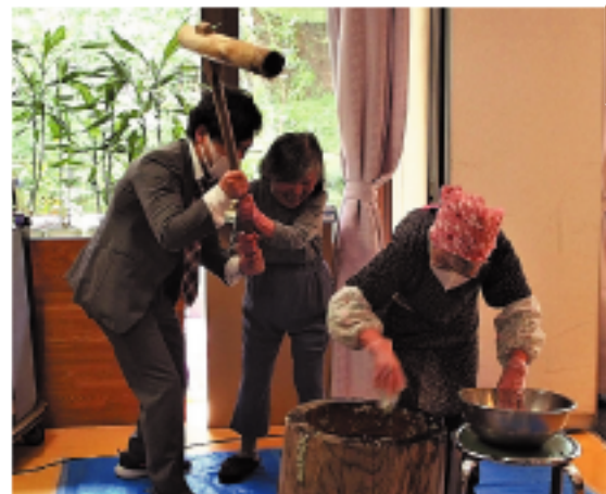
職員の手を借りて杵を振るうご利用者。小さな体でも力強く搦っていました

偕楽園ホームの南側には駐車場として利用されている通称「さくら広場」があります。去る、4月6日(火)と12日(月)に、施設内から桜を見上げながらの「お花見会食」が開催されました。