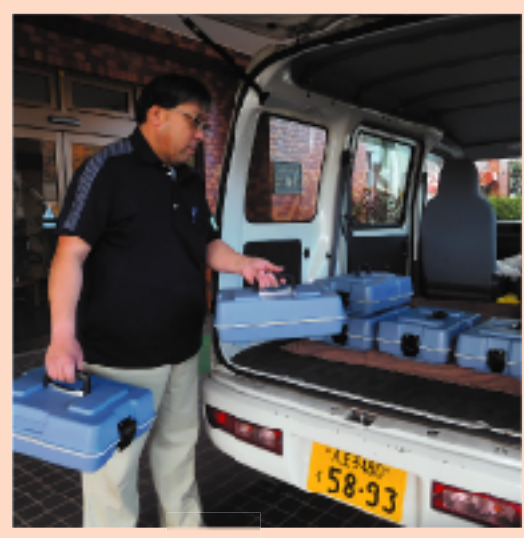
配食サービスは継続して行っています

今後も、感染症対策を万全に「命を守ること」を最優先に、今だからこそ大切な黄金の教育に全力を尽くしていきます。