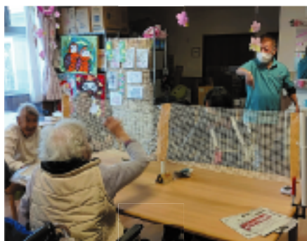
その名も「となりの虎」。新聞紙を片手で丸め、より多くの新聞紙を相子陣地に投げた者が勝者となるゲームです