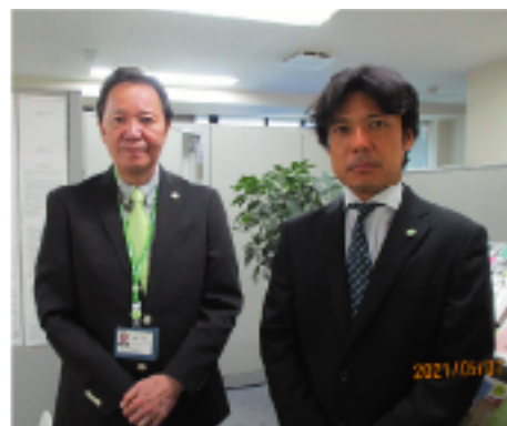
生活支援センターは地域における生活支援センターの体制構築に向け「ネットワーク作り」を行います