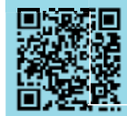
デイサービスセンター初音の杜さん (@hatune8239) / Twitter 日々の様子を配信中

園 芸活動も認知症ケアの一つですが、人が生活を営む上で緑を観る、土をいじるといった喜びは多くの人々が感じる活動です。 一般的にもガーデニングは、「果樹、野菜、花の手入れ、育て、収穫し、食卓にのぼらせ、生活を彩る」といった過程で、仲間と交流するきっかけにもつながります。 園芸作業では、座る、立ち上がる、掘る、水をまく、雑草を取りなど、数多くの動作を必要とするため、身体面では、運動能力や体力の維持増進、精神面でも、満足感や達成感、気分転換や記憶力の改善などの効果が期待されています。 デイサービスセンター初音の杜さん (@hatune8239) / Twitter 日々の様子を配信中