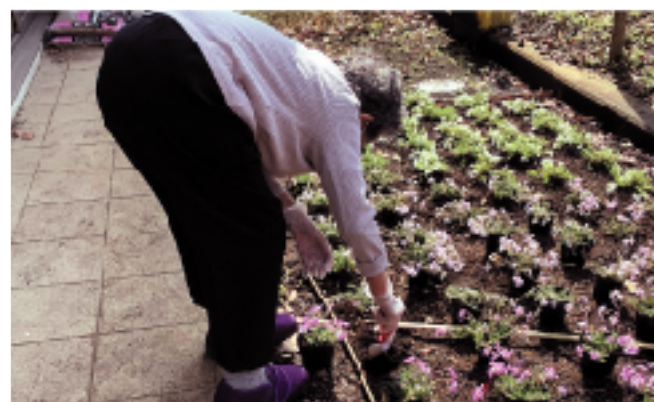
実施に際してはボランティアさんにも協力いただき行いました