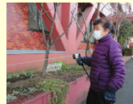
緊急事態宣言が解除された際には、感染予防に努めながら活動も再開していく予定です。

4月25日(日)から新型コロナウイルスの感染拡大に伴う予防のために、緊急事態宣言の発令に伴い、宣言発令中のボランティア活動は活動休止しています。一方、園芸など園外で活動されるボランティアに