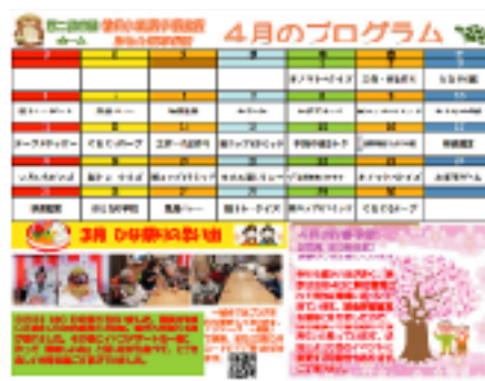
毎月新しいレクリエーションを創作することは、なかなか大変な作業です…