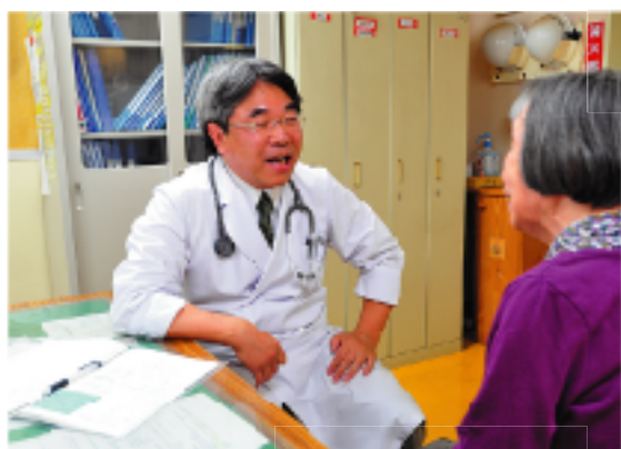
主治医とはしっかりと連携する必要があるため、主治医との情報交換も重要です

訪問看護ステーションとの連携による医療ケア グループホームを利用されているご利用者へ提供される医療ケアは、訪問看護ステーションの看護師と連携し、24時間の連絡体制を確保しつつ、ご利用者の健康管理を日常的に行ったり、ご利用者の状態を判断して看護