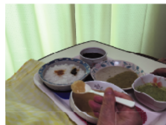
お試して一口から始めた食事が、施設のペースト食2回まで提供できるようになりました。あともう少し量を越えてご利用者の思いに本気で応えたいと思います。

多少粒の入った介護食が食べられるようになっていきました。そして、4月には施設で提供する食事のペースト食を開始するまでになりました。口腔マツサージや発声練習、口腔ケアにも介護職員が丁寧に対応するなど、ご本人の食べる喜びを味わうために、全職員が連携しています。今後朝昼夕食ともお口から召しあがっていただけるよう、ご本人と共に頑張っていきたいと思っています。