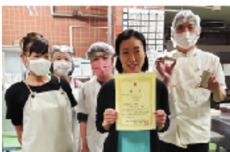
ご利用者が「うわぁ、美味しそう!」と言ってくれる、そう言ってほしくて、盛り付けにもこだわりました

そこで国は、介護・障害・子ども・困窮の相談支援に関わる事業の役割を地域包括支援センターに一本化します。実施については自治体に委ねられてるいいことから、一誠会としても八王子市の対応に注視しなければならないと思っています。