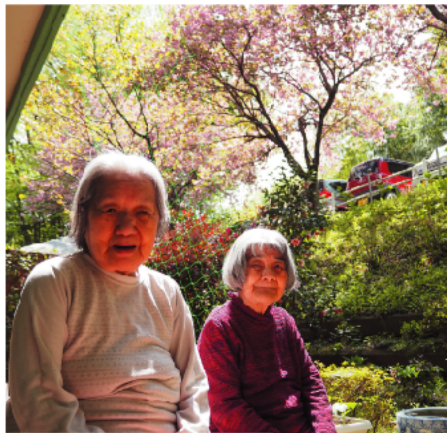
さくら広場の八重桜を見上げていたご利用者さん。ちよつと眩しそうです

コロナ禍でも桜を見上げながら季節外れの餅つき大会 昔ながらの行事で皆さんが笑顔に。コロナ禍の閉塞感を吹き飛ばす催しになりました