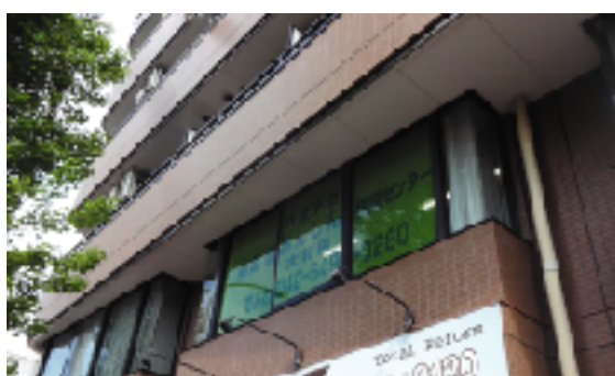
地域包括支援センターには「断らない相談支援」を目指し、就労支援や居住支援など、多様な支援の提供が求められます

庭で作れる、ごちそう食1品」がテーマで、偕楽園ホームは「はんぺんと鶏挽肉のパン粉焼」を応募しました。今後も、ご利用者のお身体の状態や体調に合わせた食事、旬の食材にこだわったバランスの良い食事を提供していきたいと思っています。