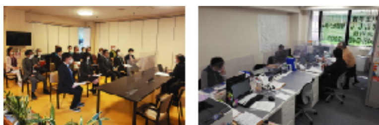
ISO9001は業務の継続的改善を進められ、様々な変化に対応するうえでも非常に有用であることを実感できます

ISOによって全ての業務が文書化され、記録が管理されることで個人情報保護と管理に関わる全ての業務を、個人情報の流れに沿って整理されることになり、かつISOという第三者機関による審査が加わることでより個人情報安全に保護されることとなります。