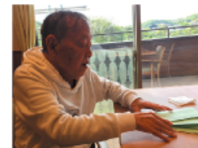
いくらでも言ってくれればお手伝いするよ。と、優しい一言

そして、やり遂げた達成感と役割を果たした充実感は目の輝きと顔つきが変わります。今後ご利用者の『できること』を大切にするケアに努めていきたいと思っています。