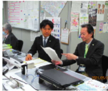
認知症地域支援事業は認知症の方からの認知症に関する相談、地域の支援ネットワークの構築を行います

あくまでも地域の方が主体となる取り組みですので、ご興味のある方はお気軽に「高齢者あんしん相談センター大和田」までお問い合わせください。