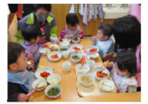
みんなで一緒に食べるとおいしいね！