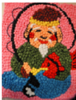
千代紙アート。「第二の脳」とも呼ばれる指を積極的に用いることは、認知症予防にも効果的です