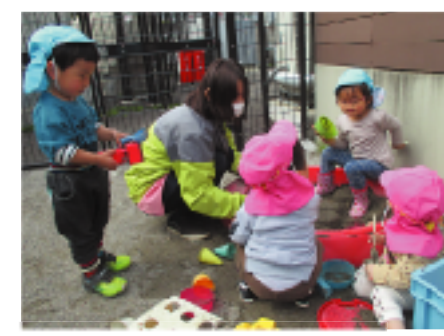
みんなが大好きお砂場遊び。お友達と一緒にだと楽しいね！