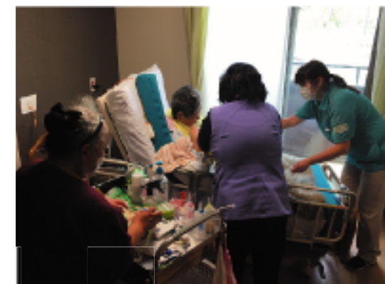
まさに多職種協働。みんなの力を合わせてご本人の思いに応えます

入居されたときは、脳梗塞で、胃ろうで1日3回栄養を注入していたTさん。カンファレンスの際、ご本人から「ご飯が食べたい。」との希望があり、その思いを受けて令和元年5月より経口移行の取り組みを管理栄養士と看護師とが中心となり、はじまりました。訪問歯科医の方々にも協力を得て飲み込みの検査を行いながらステップアップを図り、トロミのついた水分からはじまり、