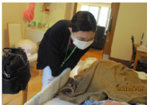
看取り期にあるご利用者や医療機関から退院されたご利用者への生活復帰のためのリハビリなども行います

グループホームの医療連携体制 グループホームは、職員の配置基準上、医療職の配置義務はありません。それでも、認知症高齢者は環境の変化を受けやすく、グループホームにおいて継続した生活を送るためには、利用者の状態に応じた医療ニーズに対応できるように、看護体制を整備する必要があります。 このたび、第二借楽園ホーム