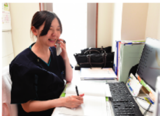
第二借楽園ホーム訪問看護ステーションは平成30年に開設しました

一誠会では、様々な認知症ケアの取り組みを行っています。 ここでは、初音の杜のグループホーム（以下GH）が行っている取り組みを紹介します。