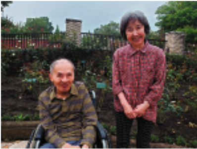
バラ園の前でチーズ！バラの香りには癒しの効果もあります