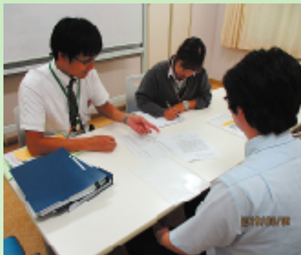
週1回の会議で、必要な情報を共有します

居宅介護支援では、ケアマネジャーがそれぞれの担当を受け持ち、ご利用者、ご家族の意向や現状を確認しながら様々な生活を支援するケアプランを作成します。 現在借楽園ホーム居宅介護支援事業所では、3名のケアマネジャーがそれぞれの担当を受け持っていますが、週に1度は会議を開催し、情報の共有、相談を行っています。お一人暮らしの方や、状態