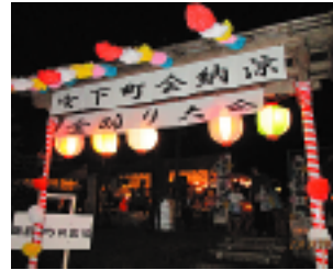
地域により根付くように積極的な地域貢献に取組みます

去る、7月20日(土)、宮下町会納涼盆踊り大会が宮下町の鶴舞の広場で開催されました。 一誠会から今年もやきそばやフランクフルトなどの屋台を出店しました。 職員にご利用者とともに地域の皆様と楽しく交流を図らせていただくことができました。