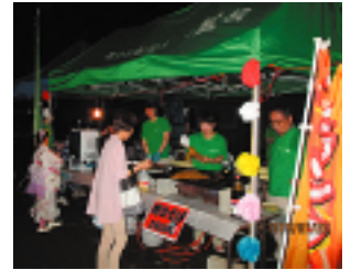
天候にも恵まれ、暑い一日でしたが屋台のかき氷はとても好評でした