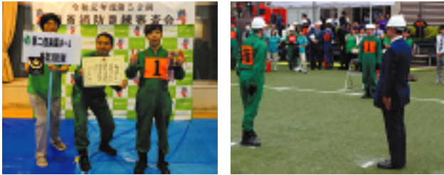
準優勝とはいえ、得点は優勝チームと同点。優劣をつけるという規則による準優勝という結果でした

去る7月18日(木)、八王子市舟木町にあります創価大学グラウンドで行われた令和元年度 第52回 自衛消防訓練審査会において、第二偕楽園ホーム自衛消防隊が2号消火栓男子の部に出場し、初出場ながら見事準優勝に輝きました! 当日は、多くの職員も応援にかけつけてくれました。