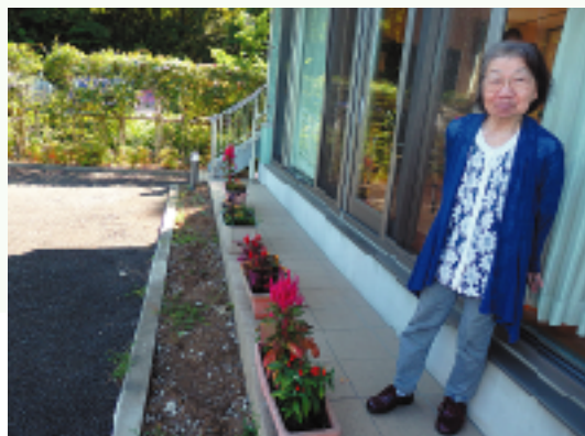
デイサービス、訪問介護、配食サービスを組み合わせて自宅での生活を支援しています