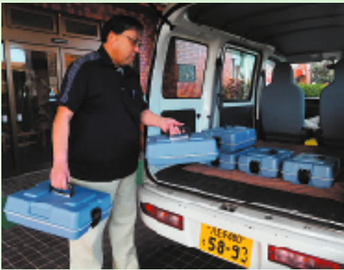
料金は昼夜ともに400円(治療食は500円)リーズナブルな金額設定で利用しやすい金額設定にしています

配食サービスでは、単に食事を提供するだけでなく、安否の確認も含めて配達員が直接手渡しするなどして、できる限りご自宅で安全に高齢者の独居や認知症の問題なども含め、安全に生活が送れるよう支援します。