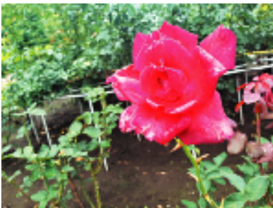
バラ園のバラ。赤色のバラには「情熱」という花言葉があります