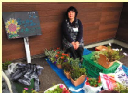
第二借楽園ホームでもボランティア活動していただく方を随時募集しております