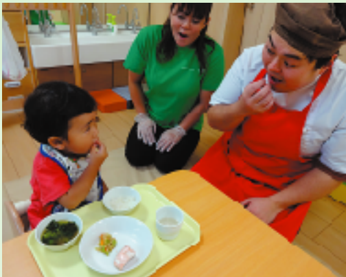
保育所で過ごす時期は、味覚・食生活が形成される大事な時期。手作りで安心・安全な給食を提供しています