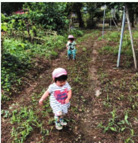
不安定な道でもバランスをとりながら、上手に歩いて意欲的な子ども達です