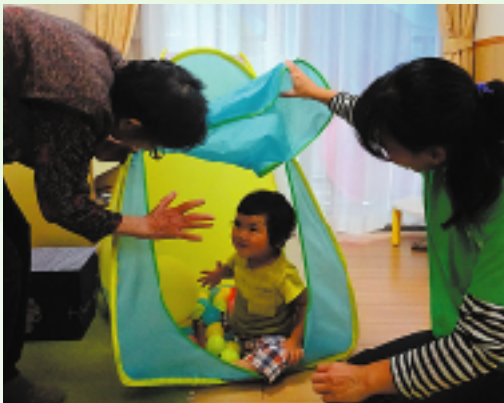
子どもたちが自発的に取り組み集中し個性を伸ばすことができるような保育を展開します