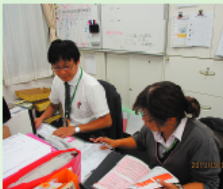
ケアマネジャー同士で、研修や勉強会の報告もしています

が不安定なご利用者の情報が共有をすることで、担当ケアマネジャーが不在の時でも適切な対応ができるようになっています。また、研修に参加したケアマネジャーから、研修内容の報告を行い、常に新しい情報を共有しています。 週に1度の会議を行う事で、普段はそれぞれで動くこと多いケアマネジャーの仕事も統一した対応ができるようになっています。