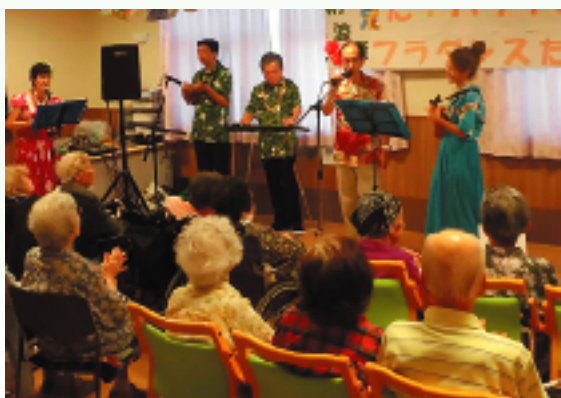
衣装も踊りもバッチリ!? 普段とは違う看多機職員によるフラダンスも大変盛り上がりました!