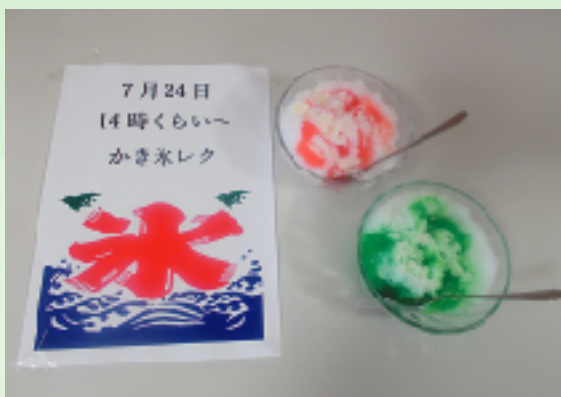
イチゴ味とメロン味にお好みで練乳つきのかき氷に、参加されたご利用者の皆さん舌鼓