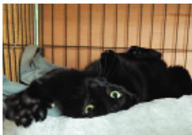
つれない素振りから一転して甘えてみせるクロちゃん