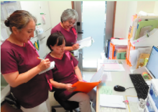
今後も研修で得られた知識を共有し一層の研鑽に努めて参ります