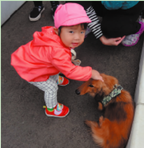
犬との暮らしは、情操教育に良いというだけでなく、子どもの免疫力が上がるという研究結果もあります