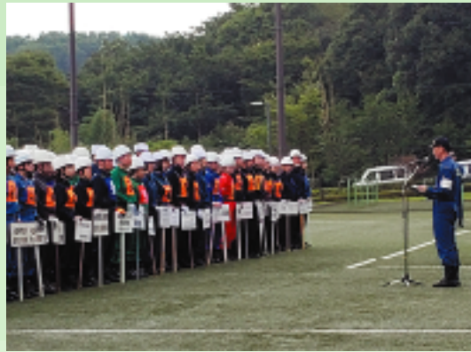
緊張の面持ちで開会式に臨む参加選手たちに見ている側も気合いが入ります

「結果は8位となつてしまつたが、自衛消防訓練審査会を実施することで、人々を守る防災の大切さを意識することができ、いい経験になつた。」と話してくれました。