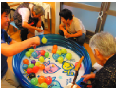
当日は、ボランティアさんもご利用者ととにも一緒に楽しめました