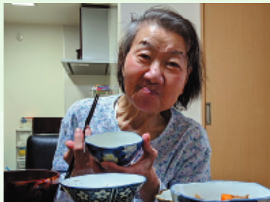
介護はご利用者個々の状況に応じて異なりますが、元気にお過ごしいただけるようお手伝いさせていただきます