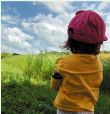
広く青い空と自然の香りに風を感じて散歩を楽しんでいます