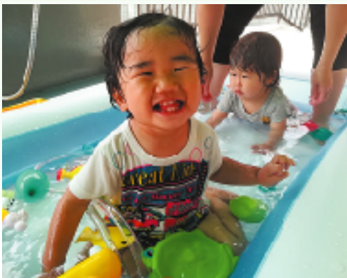
プール遊びも個々の発達段階にあった環境を設定することで、安心してのびのびと水遊びが楽しめます