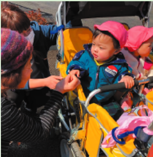
ホームの高齢者だけでなく、地域との関わりを深めることも大事な活動です(春の芋煮会より)

「それぞれの子どもの違いを認めること」「自分の考えをしつかり持ち、それを他人にきちんと伝えること」を通して『生きる力』を育むというものです。