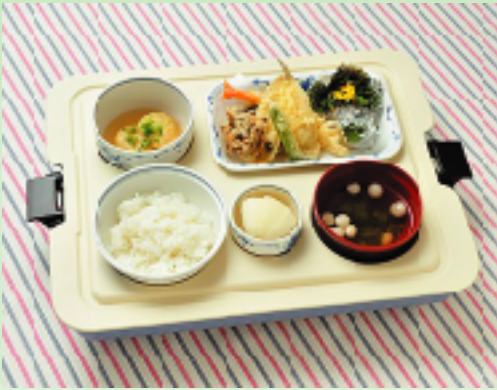
糖尿病や減塩食など健康面にも配慮する治療食についても、主治医の指示に基づきお届けします

65歳以上のお一人暮らしや高齢者のみの世帯、日中介護者が不在のため食事の支度に困っている地域の方へ食事をお届けするサービスです。