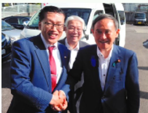
菅 義偉 内閣官房長官(写真右)とともに

現在の介護業界は、厳しい経営状況が続いています。こうしたことから脱却するためにも政治の力は必要不可欠です。社会を変えることができる平等の権利が投票であること、もちろん、福祉・介護を担っている方々に限ったことではありません。ありませ